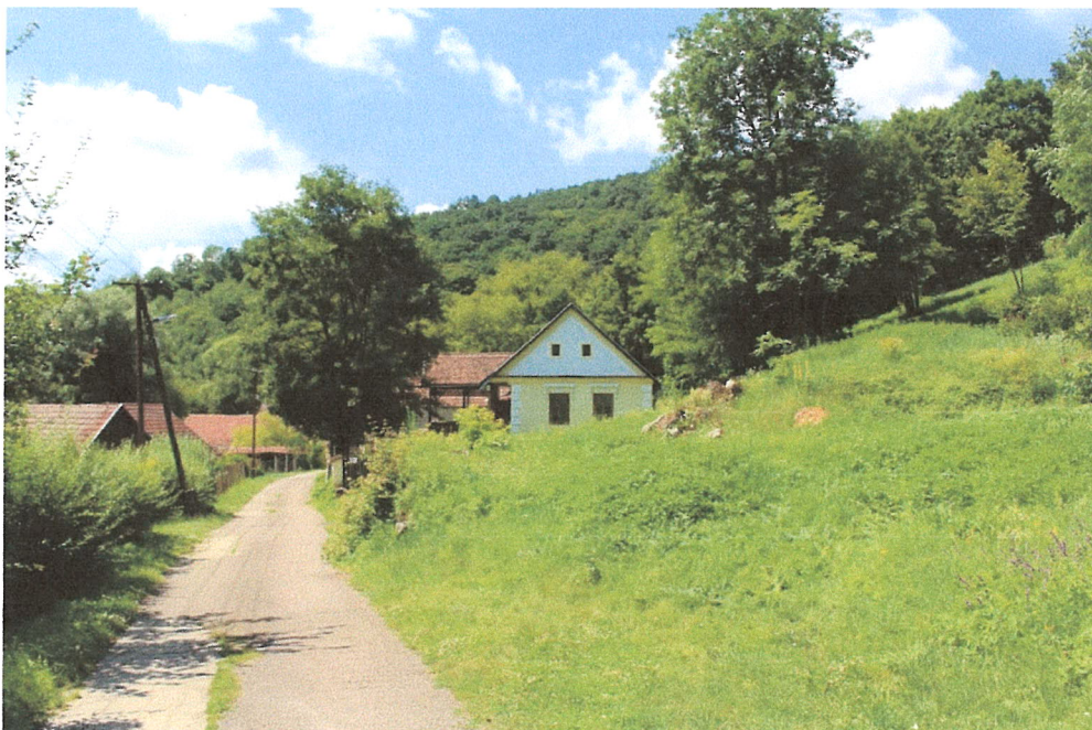
2. ábra – A ház feltárulása a Rákóczi Ferenc utcán haladva, jellemző látképi elem. A szomszédos telek gondozatlansága jelentősen ront a látképen