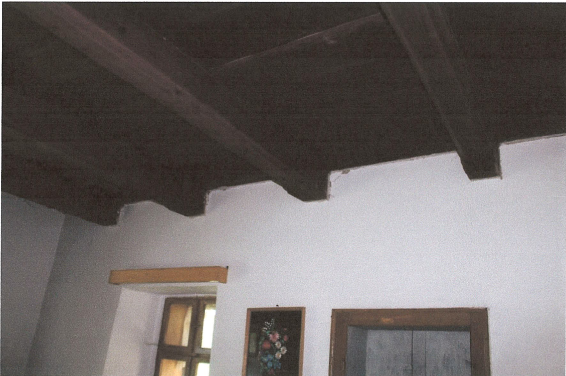
6. kép – födémgerendák az első szobában