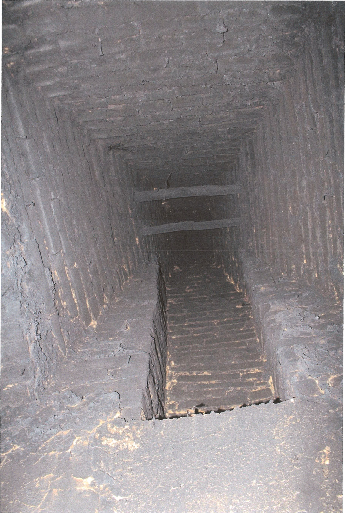
9. ábra – szabadkémény füstölőrudakkal a torokban