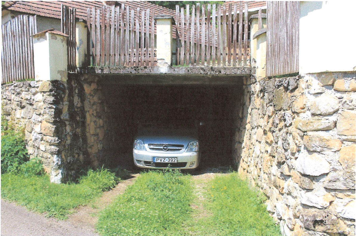
3. ábra – támfalgarázs a déli telekhatáron