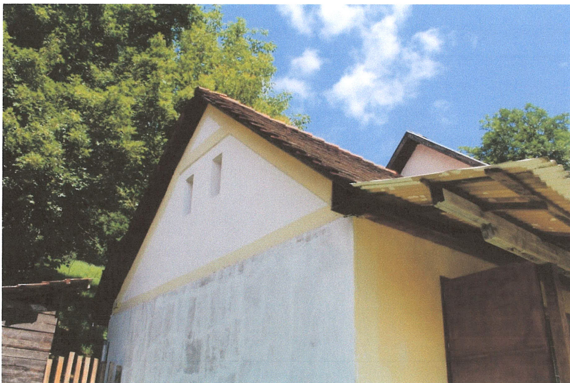
12. ábra – hozzáépítés és első házrész tetőgeometriája