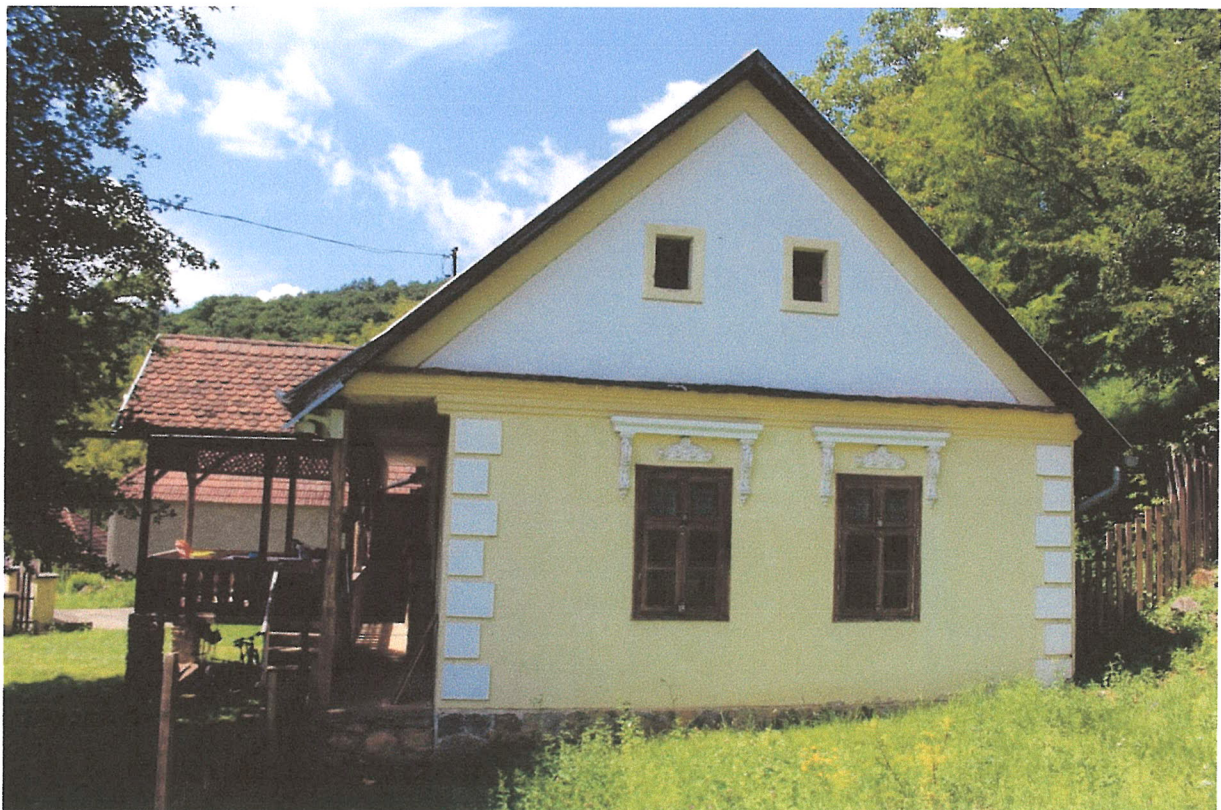
14. ábra – főhomlokzati megjelenés: értékes nyíláskeretezés, osztópárkány, nyílásrend. A sarokarmírozás feltehetően utángyártott, eredeti helyzete vizsgálendő