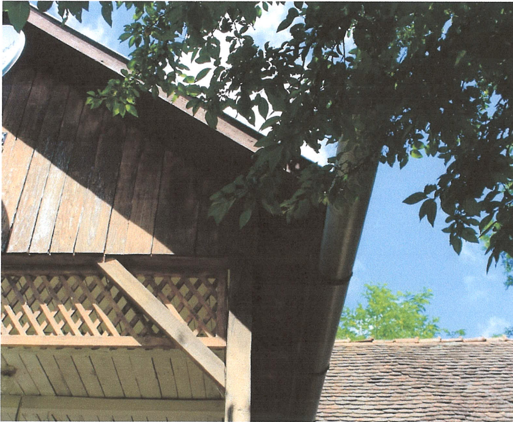
13. ábra – timpanon részlete könyökfákkal, rácsozattal, deszkázott oromfallal