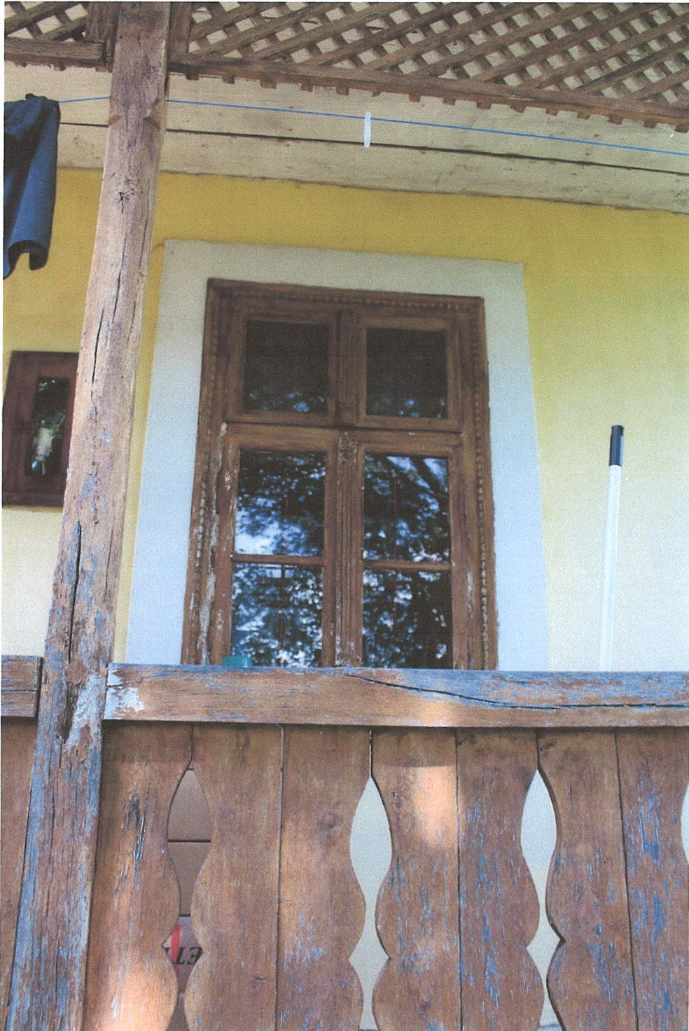
15. ábra – főhomlokzattal megegyező történeti fa ablakok tornác felé