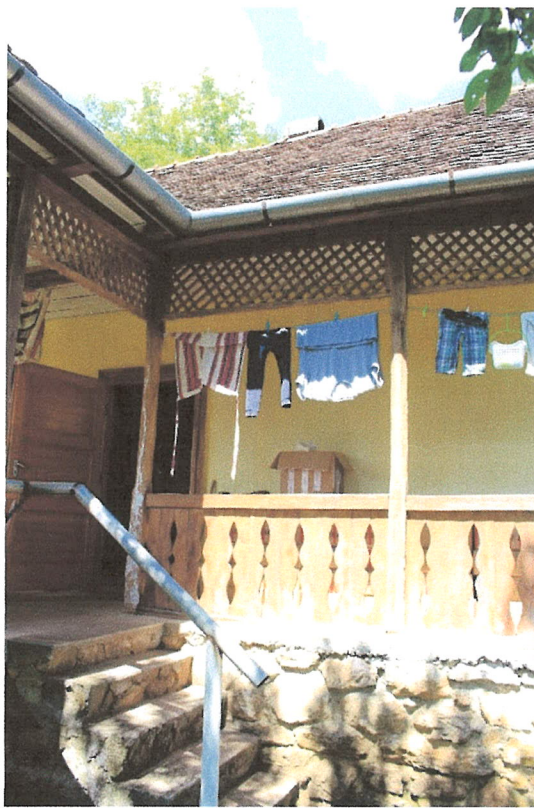
11. ábra – átépített tornác: feltehetően eredeti pillérek, utólagos mellvéd, rács, lépcső és fogózdó