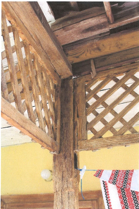
10. ábra – timpanon és tornác találkozásának faszerkezetei