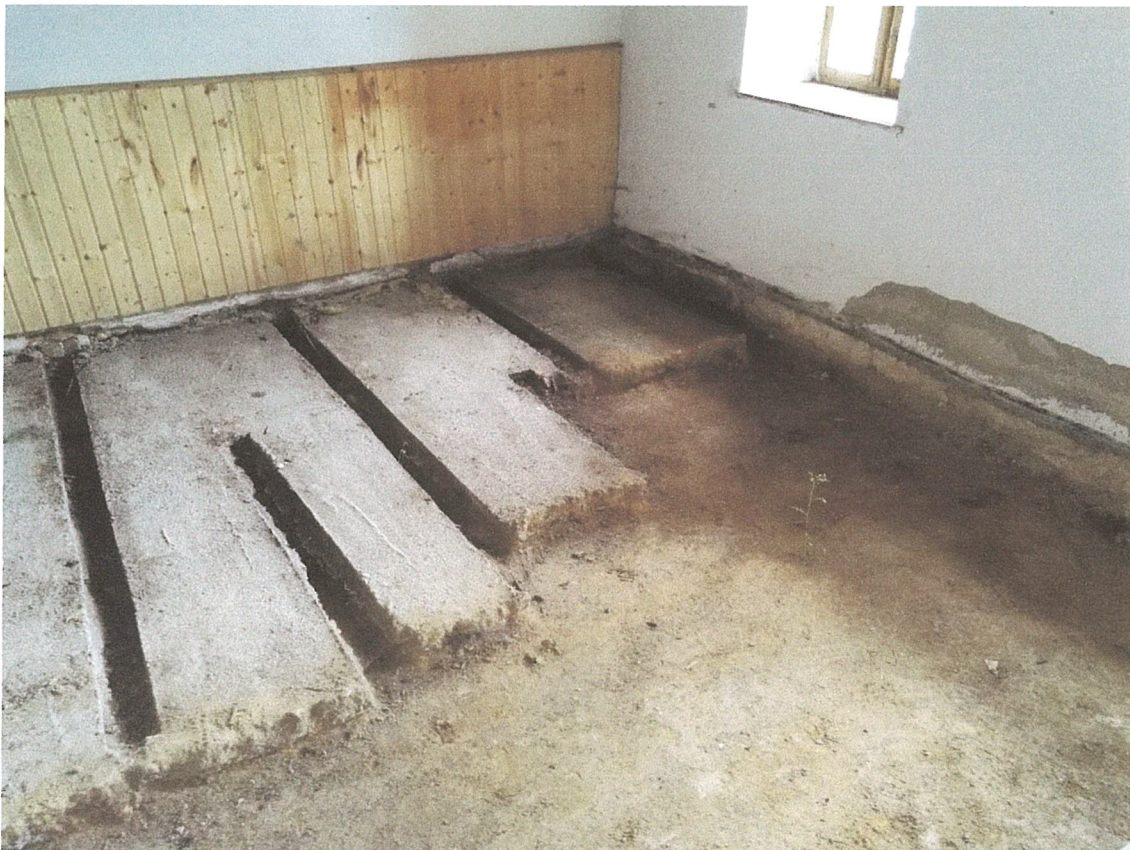
7. kép – átalakításhoz felvert padló, későbbiekben bontandó beton szerkezetek az első szobában