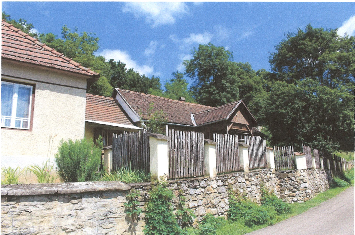
4. ábra – festői feltárulás nyugati irányból, szembeűnő a todalék előnytelen melléképület-jellege