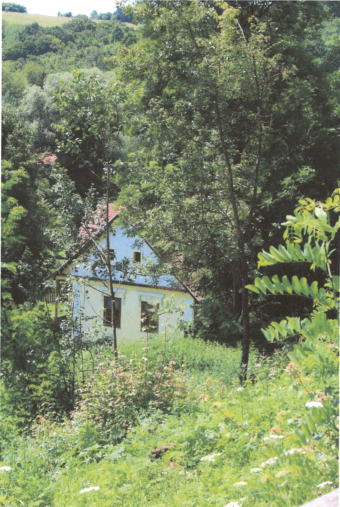
5. ábra – a ház nyári képe a templom felől, a tető lejtő felőli oldala takart